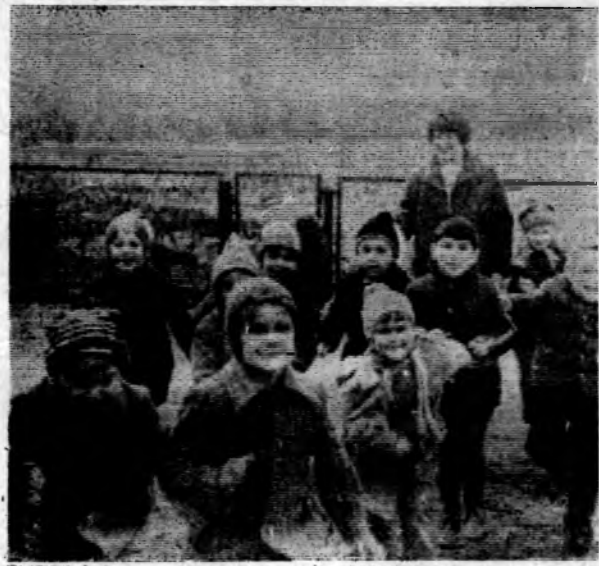
Весна полностью вступила в свои права. Сохнет земля, зеленеют лужайки. Детсадовской дворец прибавилось веселья. Хорошо играли на свежем воздухе! Этот снимок наш фотокорреспондент В. Комиссаров сделал в детском саду «Электрончик».

Е. ЖУРАВЛЕВА, воспитатель общежития № 1 УС «Волгодонскэнергожилетстрой».